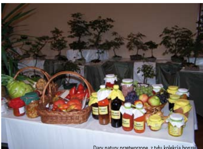
Dary natury przetworzone, z tyłu kolekcja bonsai