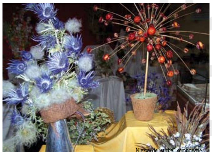
Niezwykłe „suche” kompozycje