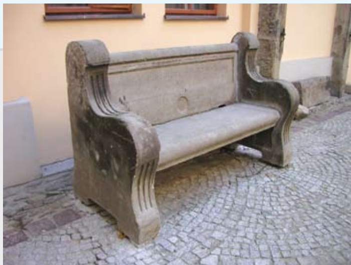
Kamienna ławka na dziedzińcu Muzeum, pamiątka po jednym z austriackich pułków stacjonujących w Cieszynie

Zapraszamy Czytelników do współredagowania tej strony. Prosimy o nadsyłanie ciekawostek związanych z Cieszynem (np. anegdot, przepisów kulinarnych, zdjęć, dokumentów, wzorów rękodzieła artystycznego itp.), które mogłyby zainteresować innych i wzbogacić wiedzę o naszym mieście. Gwarantujemy zwrot wszystkich otrzymanych materiałów.