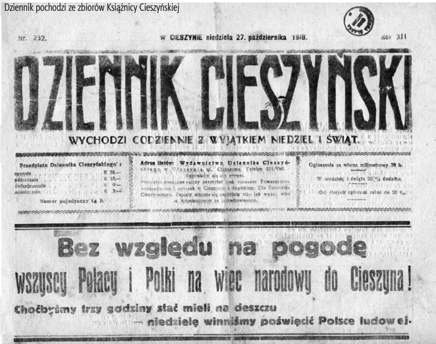
„Dziennik Cieszyński”, z dnia 27.10.1918 r., z zaproszeniem na wiec

Dziennik pochodzi ze zbiorów Książnicy Cieszyńskiej