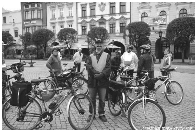
Uczestnicy masy krytycznej